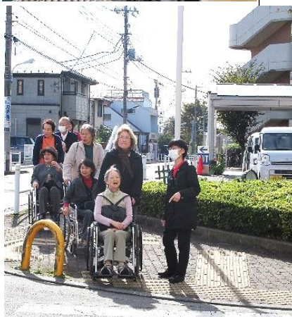
乗る側と押す側両方の体験