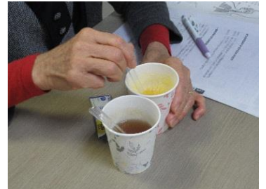
トロミについて 管理栄養士 福井職員