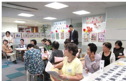
ボランティアの皆様集合 キートス広場

9時15分にボランティアの皆様にご集合頂き、キートス広場で園長・平田SMG・土方室長よりのご挨拶後、各フロア担当職員より、当日のスケジュールの説明がありました。