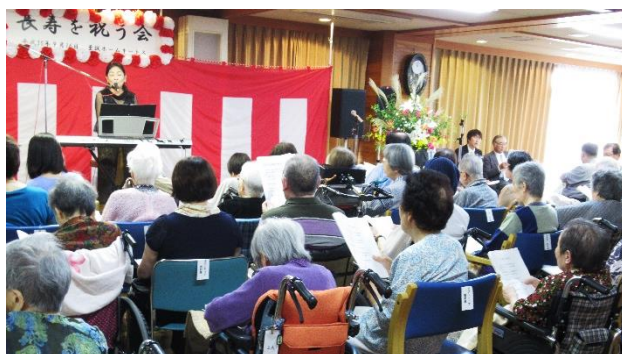
式典10:00あおぞら広場