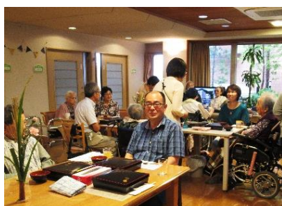
各ユニットでご入居者、ご家族、ボランティア 皆様で楽しい祝膳