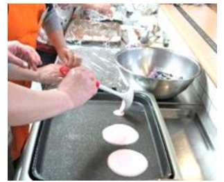
桜餅の皮を、クレープのように作っています