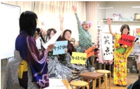
職員による演芸会 ← デイ笑点 → 長生きサンバ