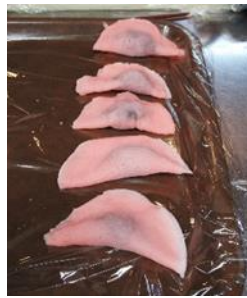
手作り桜餅の出来上がり