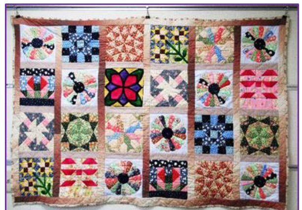
パッチワークの作品