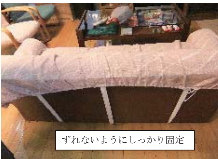
ずれないようにしっかり固定

4階団樂室 歌の会、書道生花などで4階を使う頻度が増えたため、ボランティアコーナーができました。