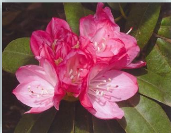
石楠花（シャクナゲ）