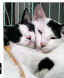
タロちゃん&ハナちゃん