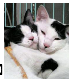
タロちゃん&ハナちゃん