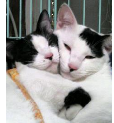
タロちゃん&ハナちゃん