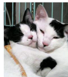
タロちゃん&ハナちゃん