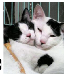
タロちゃん&ハナちゃん