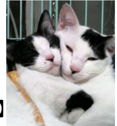
タロちゃん&ハナちゃん