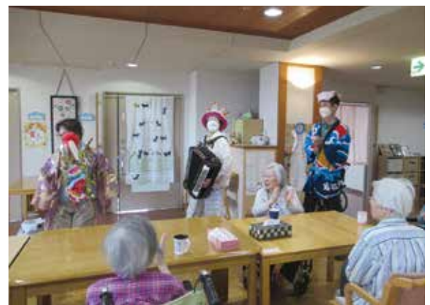
チンドン屋さんが盛り上げてくれました

コロナ禍前は「キートスマつり」としてキートスケアセンター・柏センター・特養が一体となって、地域の皆様にもお