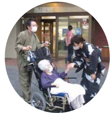
職員も浴衣に着替えて

会開始2時間くらい前から雷が鳴り始め、いつ中止と言われるか内心ヒヤヒヤしていましたが、雷も30分くらいでおさまり雨も降らず無事に開催する事ができました。