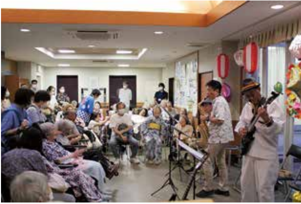
恒例のロビーコンサートで盛り上がりました

レギュラーメニューが変わらずの人気ぶり、開始早々行列ができました。国分寺市社協さんからお借りした綿菓子機でつくるふわふわの綿菓子は、小さいお子様だけでなく、お年寄りにも大変好評でした。