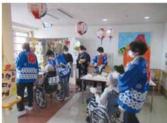
模擬店もみなさん楽しめました

7月18日はお昼前に、デイホーム職員によるチンドン屋さんが各ユニットを回って開催のピラを配り、盛り上げてくれました。お昼にはお祭りプレートとして、焼きそば・たこやき・ポテト・ソーセージ・枝豆やスイカといった夏祭り風のメニューを提供しました。午後はお遊びコーナーと綿菓子・ソフトクリーム・かき氷の模擬店で楽しんでもらいました。BGMには盆踊りの曲を流し、ボ