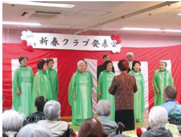
スオミコーラスりら

今年度実行委員として準備を進めていく中で、ひとつひとつのクラブに、地域の方やボランティアさんなど、多くの方々が携わつてくださっていることを改め