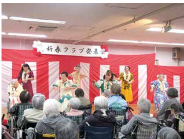
フラダンスクラブ

大きなトラブルもなく無事に終えることができ、感謝しております。地域の皆様、ボランティアの皆様、職員の皆様、ご協力ありがとうございました。