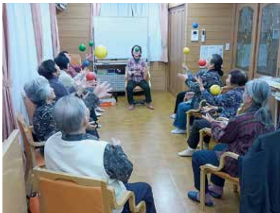
コミコミ体操の風景

平成13年から地域のサロンとして「いこいの場」の事業を開始。「コミコミ体操」「童謡・唱歌の合唱」「フラワーアレンジメント」「保育園交流会」「外出行事」「アロマ・脳トレ」「映画会」「介護のあれこれ」「栄養の摂りかた」など、レクリエーションや勉強会を実施し、自宅に籠りがちで、外出の機会が少ない高齢者などの「通いの場」となっています。また、民生委員の方も関わって下さったり、立川市の熱中症予防の為に「ひと涼みスポット」にもなっています。「いこいの場」の活動は、月々金曜日の14～16時の2時間です。ひと月200