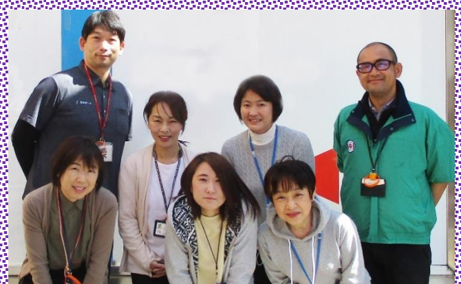
調布市地域包括支援センター 至誠しばさき