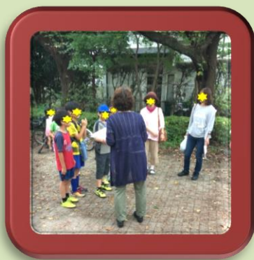
「行方不明のお年寄りをみんなで探そう」