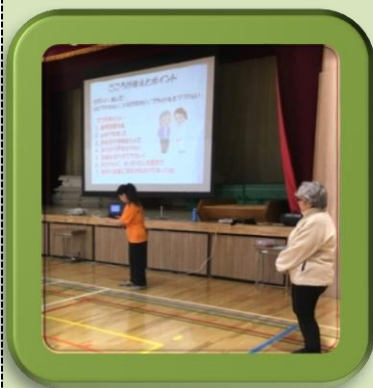
「認知症サポーター研修」

今年で3回目となり、副題に「～認知症になってもできるだけこの町で暮らしていただきたいから～」と銘打ち上野原小学校体育館を中心に実施されました。R1年9月21日 主催：上ノ原迷い人ネットワーク