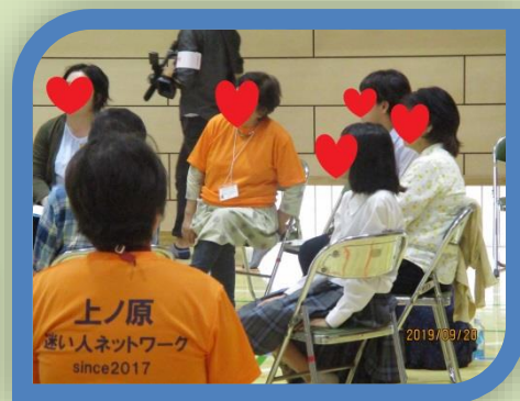
「グループで話し合い中」