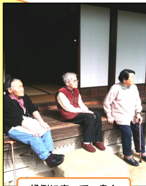
縁側に座って一息！