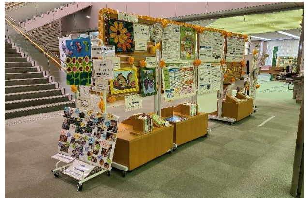
立川市中央図書館展示の様子